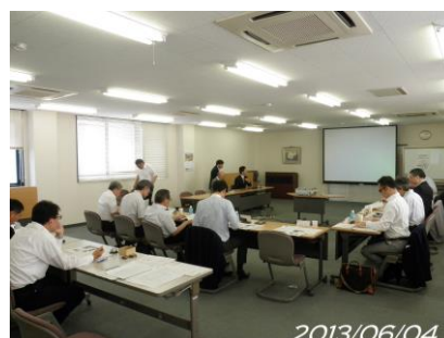
【上：事業推進委員会開催風景 下：マイルストーン分科会開催風景】