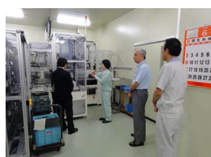
【コーディネータ活動風景】