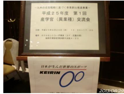
【異業種交流会開催風景】