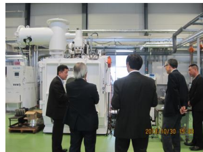
【ブラッシュアップ研究会開催風景】